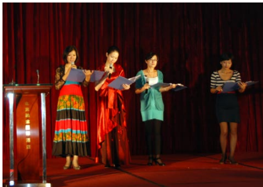
→ 力天大成2009年中秋晚会活动现场

直到听见一个熟悉的声音叫我的名字，我惊讶地抬起头，满脸通红且极不自信地看向他，也许是看到了我眼中那一点点“渴望”，也许是真的认为我可以，他只简单的一句“你没有问题！”便给了我这样一个前所未