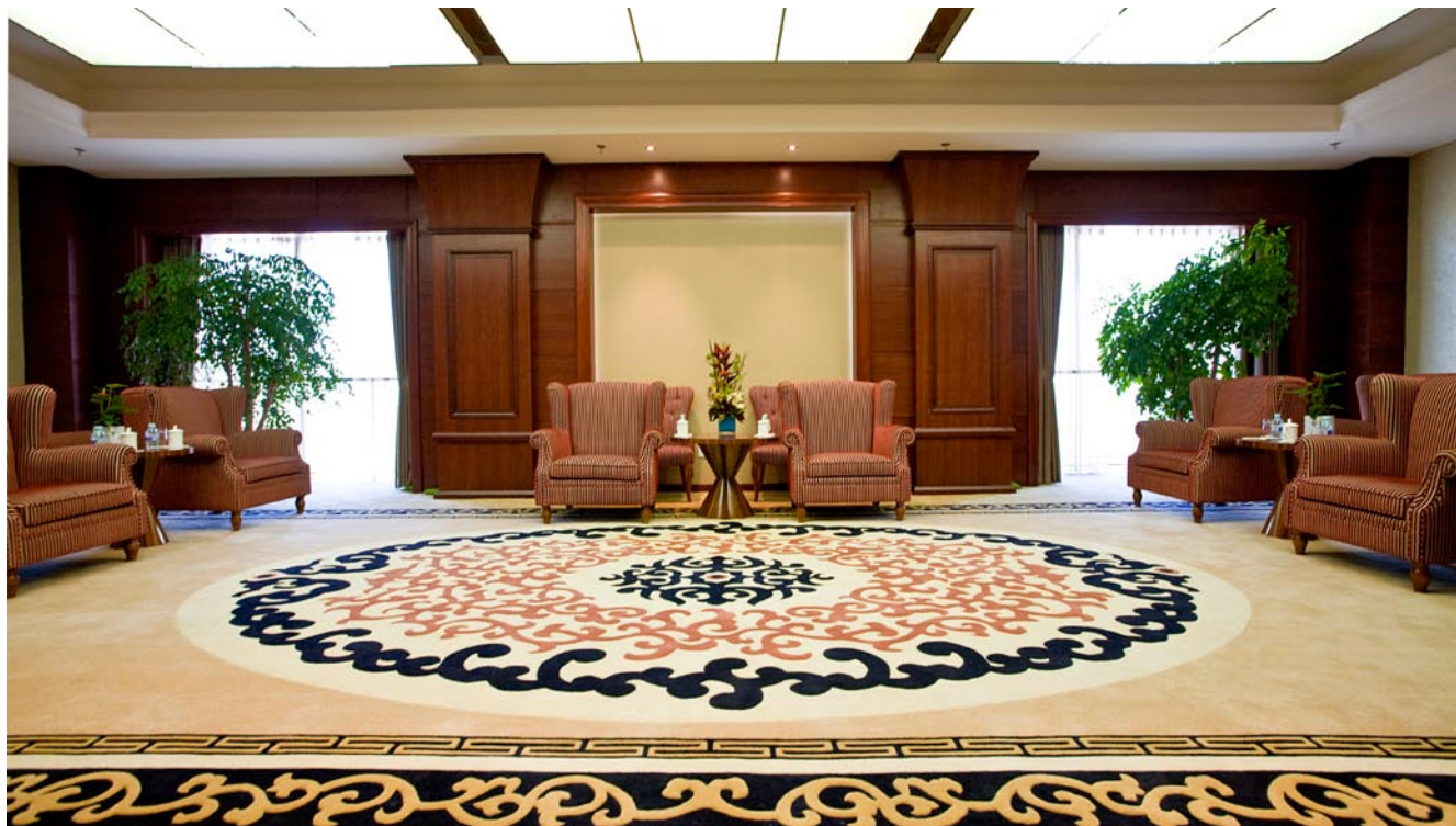
→ 长安融府办公楼内装修工程——贵宾接待室 [实景拍摄图]

每天下午我跟着朱工、孙工、严工到施工现场，寻找施工中的问题和不足。刚开始施工，一下午就能检查完，等到全面施工，从早晨开始检查，直到晚上都转不完，总感觉时间不够用似的，没多久天就黑了，甚至有时希望一天有48小时该多好。