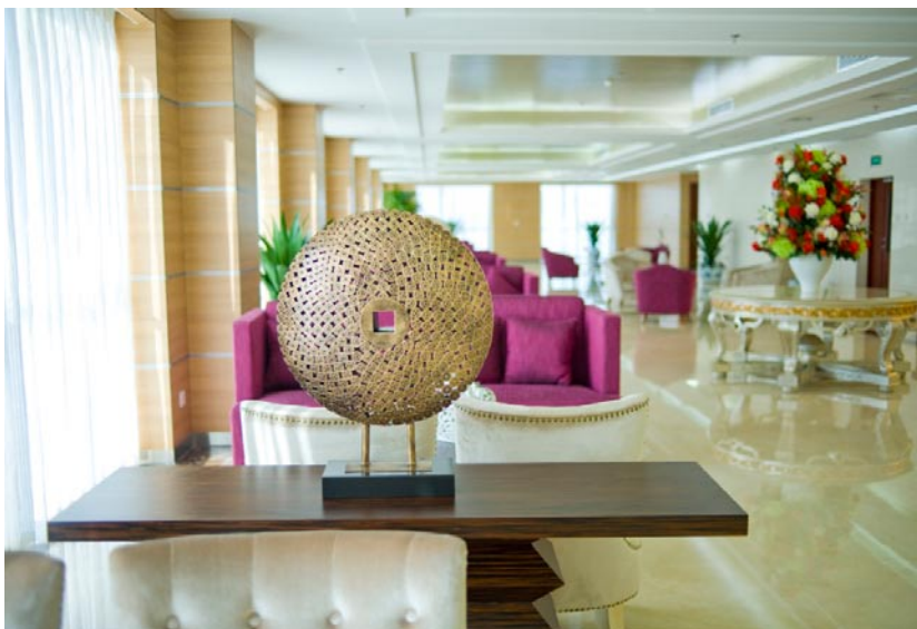
长安融府办公楼内装修工程——多功能厅 [实景拍摄图]